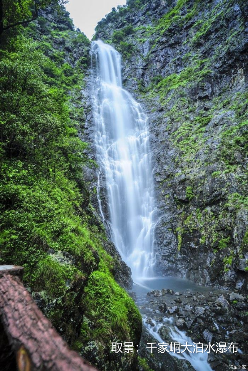
取景：千家峒大泊水瀑布